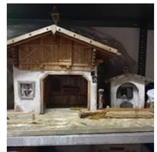
Neue Krippe in Kammerberg