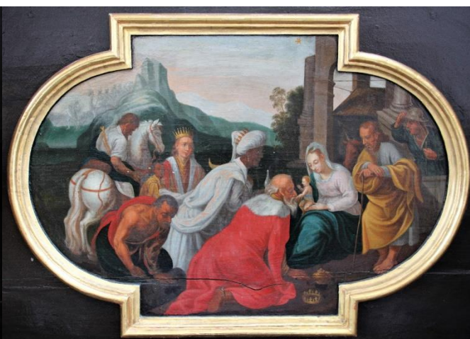
Anbetung der Weisen