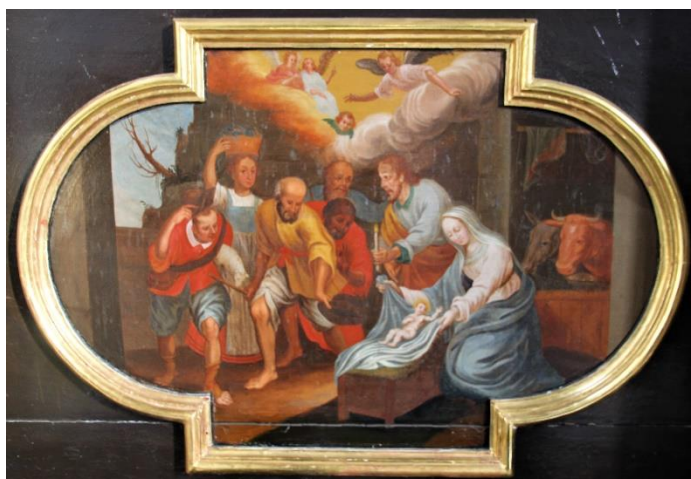
Anbetung der Hirten