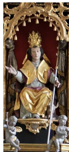
Appercha, St. Silvester